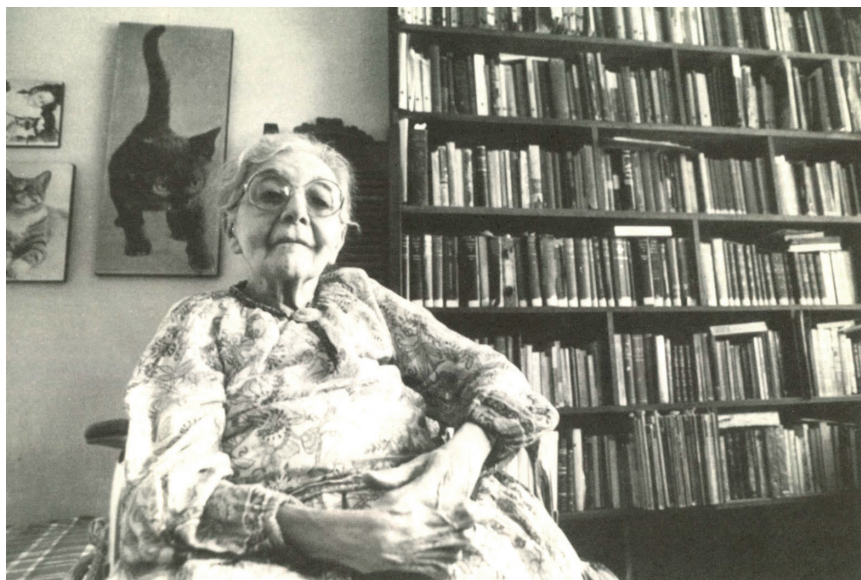
Nise da Silveira

Conhecida por humanizar o tratamento psiquiátrico no Brasil, a médica psiquiatra Nise da Silveira dedicou sua vida ao trabalho com doentes mentais, manifestando-se radicalmente contra formas que julgava agressivas em tratamentos da época. Nasceu em Maceió (AL), em 1905, e morreu no Rio de Janeiro, em 1999. Era filha de um professor de matemática e de uma pianista e cursou a Faculdade de Medicina da Bahia, de 1926 a 1931, sendo a única mulher entre os 157 homens daquela turma.