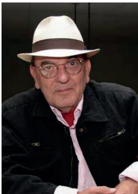
Por Carlos de Almeida Vieira Analista Didata da SPBsb

Tende piedade, Senhor, pela comida que falta na mesa pois os governantes desviaram as verbas para fins de corrupção. Tende piedade, Senhor, pelos que moram embaixo dos viadutos, a verba destinada à habitação foi parar nas contas bancárias de alguns prefeitos.